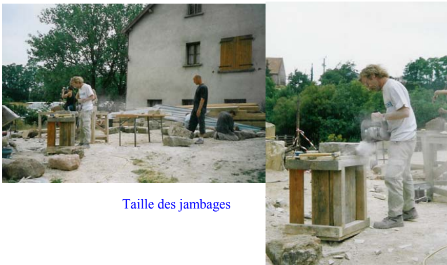
Taille des jambages

Donc nous voilà repartis vers de nouvelles aventures.